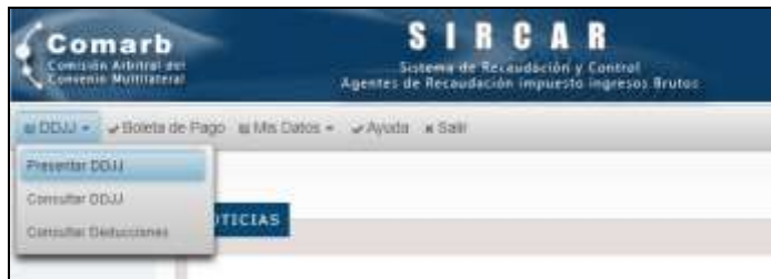
Opción Presentar DDJJ

Para realizar una presentación de Declaraciones Juradas Determinativas, deberá acceder a la opción del menú indicada con la leyenda DDJJ , y luego Presentar DDJJ .