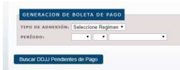
Generación de Boletas de Pago.

Para generar la Boleta de Pago, deberá acceder a la opción del menú indicada con la leyenda Boleta de Pago :