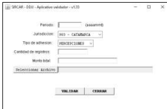
Aplicativo Validador de los archivos a adjuntar en las DDJJ

Para ejecutar este programa deben tener instalado en el equipo la Máquina Virtual de Java , si no la posee puede descargarla desde el siguiente sitio: http://www.java.com/es/ .