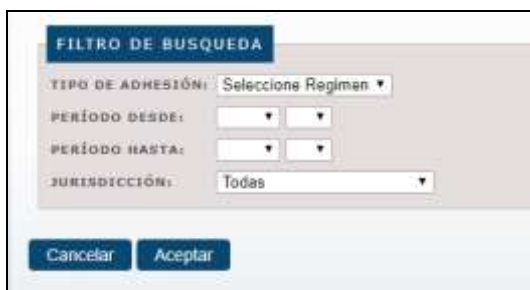
Opciones de búsqueda de DDJJ.

Para ello, deberá acceder a la opción del menú DDJJ , y luego Consultar DDJJ , donde deberá podrá elegir entre diversas opciones para la búsqueda: