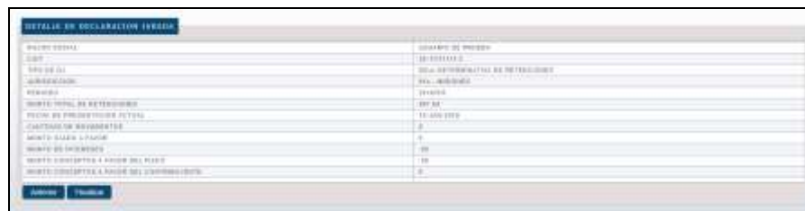
Solicitud de Confirmación de los datos enviados.

Una vez que el Sistema valida que todos los datos ingresados son correctos de acuerdo al archivo con el detalle adjunto, se muestra una pantalla resumen donde se le solicita al Agente la confirmación de la operación que va a realizar.